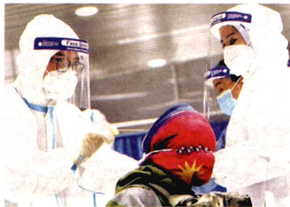
Targeted screening will be conducted upon the advice of the STFC and the state's NSC