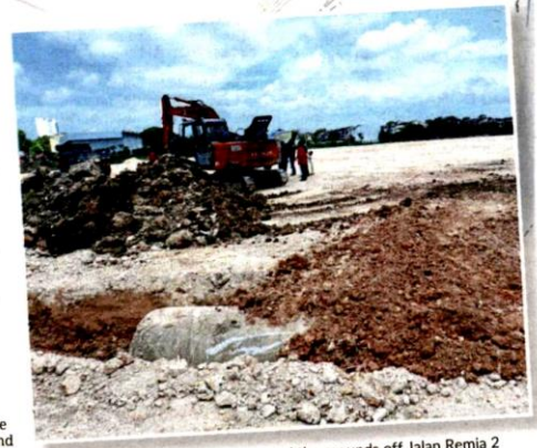
Earthworks being carried out to level the grounds off Jalan Remia 2 in Bandar Botanic, Klang, prior to the construction of Masjid Jamek Cina Muslim Klang.

"We will use teak from Thailand for the pillars and imported green coloured porcelain tiles for the roofing," he said, adding that locally manufactured tiles would be