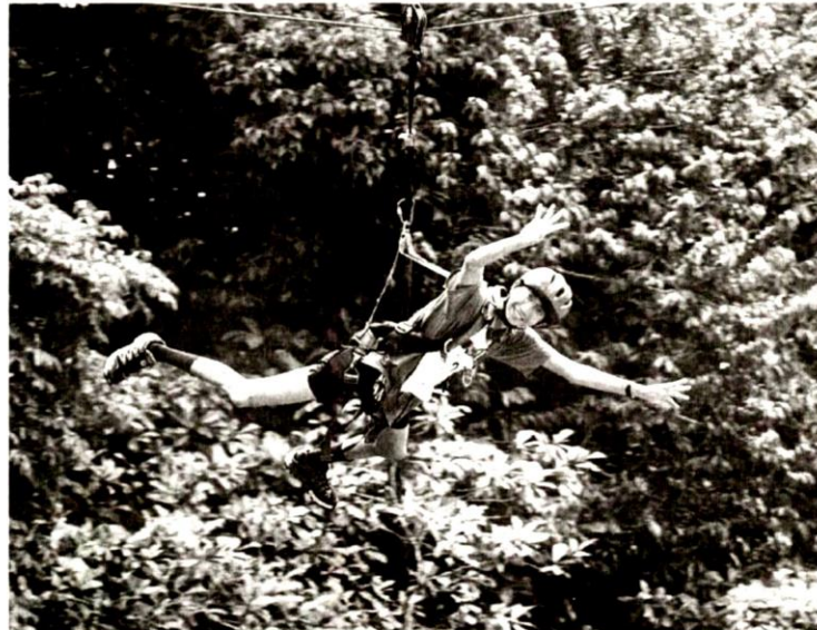
ADAKAH pengendali menginsuranskan mereka yang menyertai aktiviti sukan lasak?