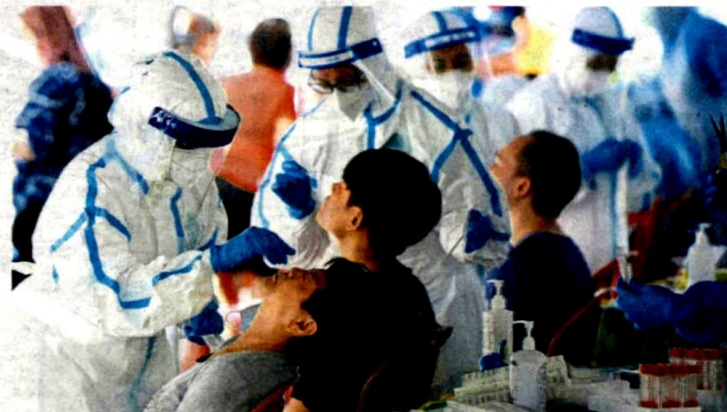
Petaling District Health Department personnel carrying out Covid-19 testing at Goodyear Court flats in Subang Jaya last week.

Info on Covid-19 cases in Selangor not coming directly from Health Ministry, says exco member