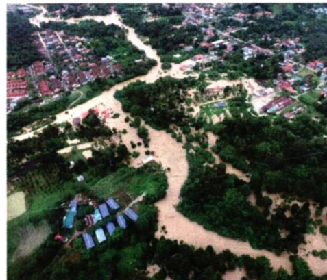
Kedudukan banjir di Hulu Langat awal pagi semalam.