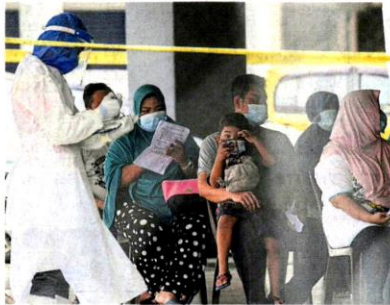
■州府第二期检测会继续进行，并依据雪州疫情情况作出调整。(档案照)