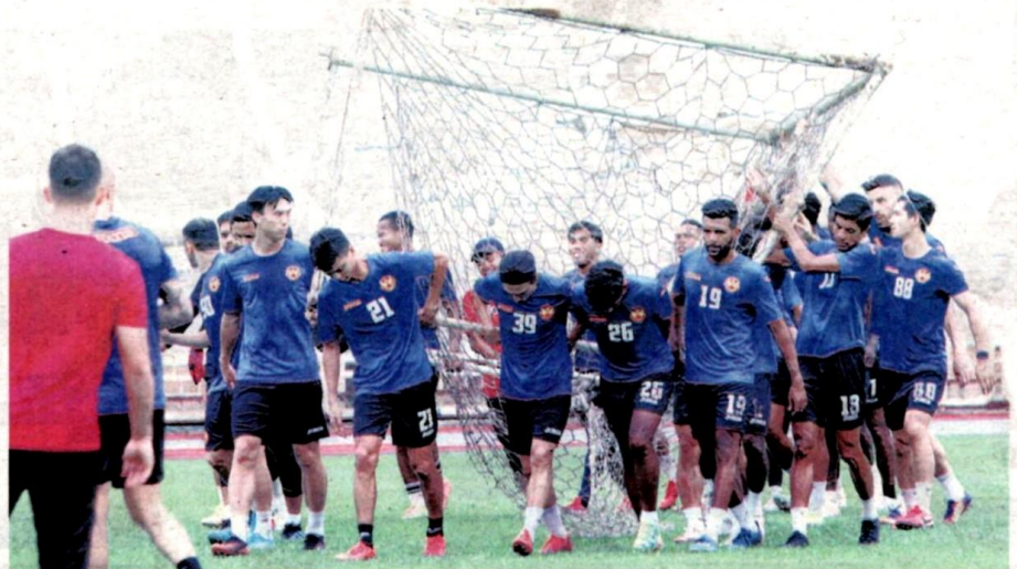
PEMAIN Selangor menjalani latihan bagi menghadapi Melaka dalam aksi pembukaan Piala Malaysia, Ahad ini.

“Ya, sebahagian peruntukan itu akan digunakan un-