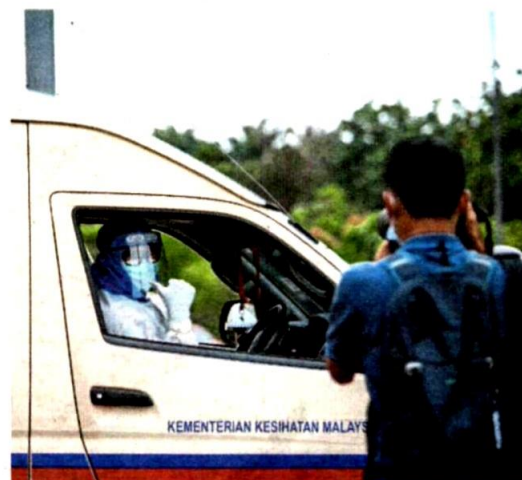
SEBUAH ambulans Kementerian Kesihatan Malaysia (KKM) memasuki lokasi Perintah Kawalan Pergerakan Diperketatkan (PKPD) di Plaza Hentian Kajang, semalam.

"Saringan fasa kedua ini mensasarkan rakyat negeri ini yang pulang dari Sabah serta kawasan berisiko tinggi," katanya.