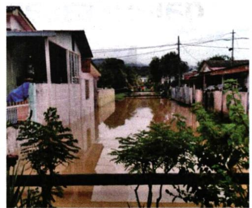
Kedudukan kawasan perumahan di Taman Sri Nanding yang dilanda banjir.